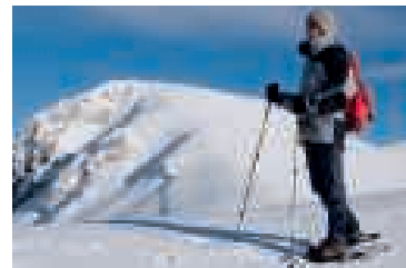
Un escursionista con le ciaspole

pratica quello che può essere definito una sorta di vagabondaggio senza una meta specifica: insomma, non si è impegnati nella pratica di uno sport dinamico e con delle regole precise (almeno di comportamento), ma si è davvero liberi di godersi la natura più sorprendente, cogliendone ogni particolare e avendo l'opportunità - con un po' di fortuna - anche di osservare la fauna delle montagne.